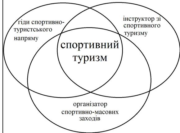
Рис.2. Види спеціалізації фахівців зі спортивного туризму.

Відповідно до схеми, фахова підготовка фахівців має здійснюватися за одним із трьох напрямів: