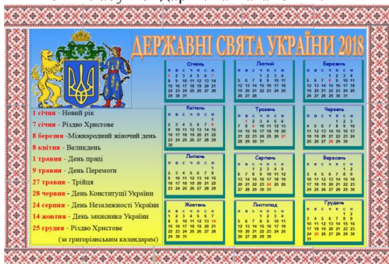
Рис. 2. Календар «Державні свята України» [7, 14]

На рисунку 2 зображено розв'язання задачі учнями 6-Б класу Бондар Б. та Таганом А.