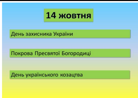
Рис. 4. Слайд 1 презентації «14 жовтня»

На рисунку 5 зображено розв’язання задачі 2.1 учнями 4-Б класу Бодрухіним М., Мараховським О.