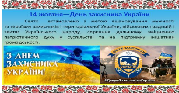
Рис. 5. Листівка «14 жовтня – День захисника України» [8, 9, 15, 16]

На рисунку 5 зображено розв’язання задачі 2.1 учнями 4-Б класу Бодрухіним М., Мараховським О.