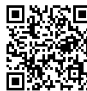
Рис. 3. QR-код

малих тіл різними способами». (Режим доступу https://fizikternopil.blogspot.com/p/3.html ). Для зручності доступу до цього ресурсу за допомогою смартфонів та планшетів учнів, згенеровано QR-код (рис. 3)