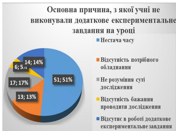
Діаграма 2. Причини не виконання експериментальних завдань на уроці.

інтернет, дозволяє інтенсифікувати виконання лабораторної роботи в класі, сприяти глибшому засвоєнню теоретичних знань, закріпленню практичних умінь та формуванню творчих здібностей. Ця тенденція відображена на діаграмі (Рис. 1)