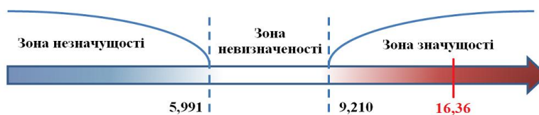
Рис. 2. Інтервали значущості для ступенів вільності N=2

Поряд із визначенням рівнів навчальних досягнень студентів ЕГ та КГ проводилася оцінка рівнів пізнавальної діяльності студентів у ході виконання фізичного практикуму з використанням КОЗН «Quantum Physics» на основі тих критеріїв і показників, що пропонувалися викладачам у вигляді фіксованих для оцінки активності ПДС. При цьому кожний з викладачів у відповідному ЗВО оцінював не лише якісну, а й кількісну активність ПДС за дев'ятьма критеріями, серед яких виокремилися два: «Стабільна мотивація та достатня активність» і «Характер спілкування з викладачем та з однокурсниками», котрі для ЕГ складають