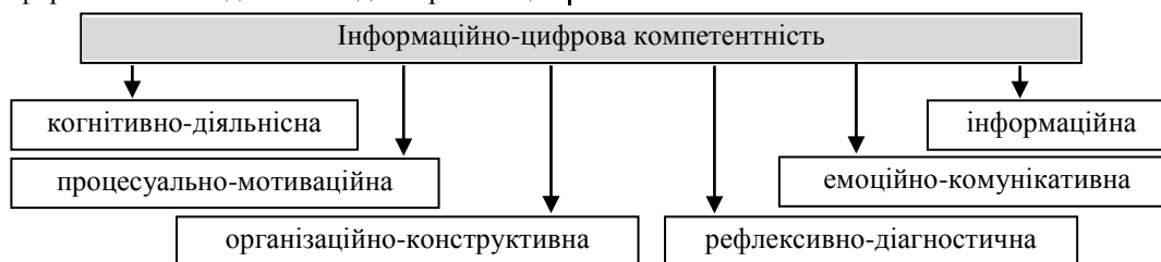
Рис. 2. Складові інформаційно-цифрової компетентності

власної навчальної діяльності з використанням ІЦР і спроможність залучати до освітньої діяльності суб'єктів навчання), емоційно-комунікативної (ступінь володіння комунікативними вміннями та емоційне ставлення до процесу навчання), інформаційної (здатність працювати з освітньо-науковою інформацією), рефлексивно-діагностична (готовність оцінювати свої знання, вміння та навички на кожному етапі їх здобуття) складових ІЦК (рис. 2).