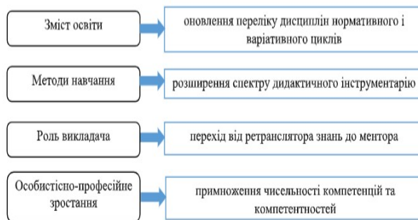
Рис. 2. Особливості процесу трансформації методичної системи підготовки майбутніх учителів інформатики за посередництвом агентів штучного інтелекту

добросчесного використання потенціалу інтелектуальних систем. Наступною у цьому переліку є так звана когнітивна – націлена на зміщення способів мислення у напрямку опрацювання значного за обсягом інформаційного контенту. Педагогічна детермінанта актуалізує трансформацію ролі учителя та методики його викладання у більш ефективну навчальну взаємодію на паритетних засадах. І останньою у досліджуваному полі для нас є інформаційно-аналітична детермінанта, яка віддзеркалює пряму готовність майбутнього учителя оперувати значними обсягами даних і на основі цього приймати педагогічно-виважені рішення.