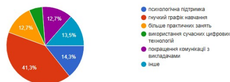
Рисунок 2 – Результати опитування здобувачів