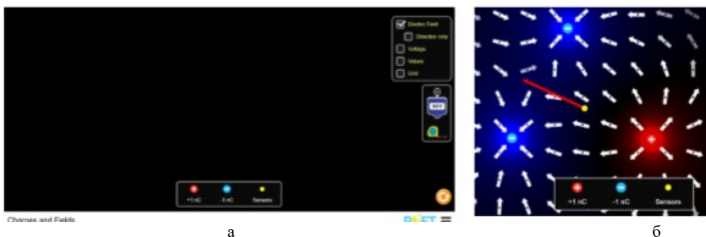
Рис. 3. Ілюстрація до виконання лабораторної роботи: а) загальний вигляд веб сторінки; б) фрагмент виконання лабораторної роботи

2. За допомогою пробного заряду (Sensors жовтого кольору) знайдіть точку поля з мінімальною напруженістю. Визначте її величину, запишіть значення та зробіть висновок стосовно положення цієї точки по відношенню до розташування всіх зарядів.