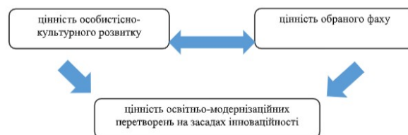
Рис. 1. Аксиологічні орієнтири державної політики у сфері неперервної освіти здобувачів наукового ступеня PhD

На сьогодні ключовими теоретико-методологічними підвалинами феноменологічного розвитку на рівні досліджуваної цільової аудиторії аспірантів виступають концепції розвивального навчання, заснованого на діяльнісних, особистісно та проблемно орієнтованих освітніх технологіях [1; 3]. За таких умов актуалізується питання стандартизації та уніфікації організаційних та змістових процедур, задля досягнення результативності на рівні суспільно діючих стандартів вихованості, освіченості та культури (див.рис. 1).