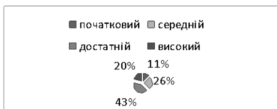
Рис. 2. Рівень сформованості комунікативної компетентності спілкування іноземною мовою

ступенів, позашкільний центр Кіровоградської міської ради Кіровоградської області». Отримані результати показують, що більше половини учнів кожного класу володіють знанневою компонентою з англійської мови (рис. 2).