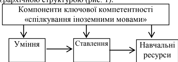
Рис. 1. Ієрархічна структура компонентів ключових компетентностей «спілкування іноземними мовами»

Фізика разом із іншими шкільними предметами робить свій внесок у формування ключових компетентностей. Аналізуючи компетентнісний потенціал фізики, нами з'ясовано, що однією з ключових компетентностей даного навчального предмету у навчальній програмі [3] визначено «спілкування іноземними мовами» (рис. 1). Компоненти ключової компетентності «спілкування іноземними мовами» можна розташувати за ієрархічною структурою (рис. 1).