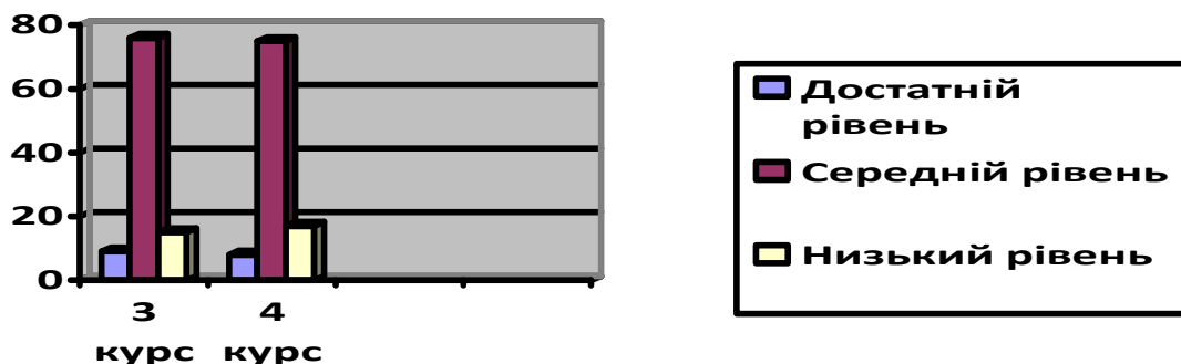
Рис. 1. Рівні сформованої саморегуляції студентів перед впровадженням системи роботи

Протягом семестру у процесі вивчення дисципліни «Елементи декоративно-прикладного мистецтва» ми використовували розроблену нами систему роботи з розвитку умінь саморегуляції навчальної діяльності студентів 3-4 курсів, зокрема, створювали розглянуті умови та впроваджували