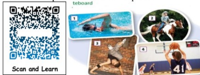
Рисунок 2 – Елемент заняття з англійської мови з використанням QR-коду

Зважаючи на викладене, можна стверджувати, що використання інформаційних методів та сучасних інноваційних технологій може значно поліпшити рівень вивчення іноземних мов в закладах вищої освіти. І врахування таких аспектів у процесі викладання, як інтерактивні заняття, інтерактивні дошки, віртуальні лабораторії та ігри, системи управління навчанням (LMS),