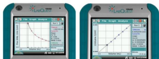
Рис. 3. Графіки залежностей

Продовжуйте цю процедуру, використовуючи об'єм 10,0, 12,5, 15,0, 17,5 і 20,0 мл. Після завершення збору даних відобразиться графік залежності тиску від об'єму (Рис. 3, а). На основі графіка залежності тиску від об'єму можна встановити, який математичний зв'язок існує між цими двома змінними, прямий чи обернений. Щоб перевірити це, виберіть Підгонка кривої в меню Аналіз. Виберіть Power як рівняння Fit. Статистика підгонки кривої для цих двох стовпців даних відображається для рівняння у вигляді y = Ax^B , де x - об'єм, y - тиск, A - константа пропорційності, а B - експонента x (об'єму) у цьому рівнянні. Якщо ви правильно визначили математичне співвідношення, лінія регресії буде майже відповідати точкам на графіку (тобто проходити через нанесені точки або поблизу них) (Рис. 3, б).