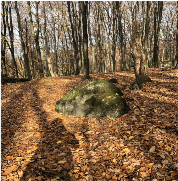
Рис. 5. Зупинка 5 «Чарівні Камені»

Пройшовши 1-1,5 км, відвідувачі наближаються до наступної зупинки маршруту, а саме до місця огляду зразу декількох чарівних локацій: міста Виноградів з сторічними виноградниками навколо нього, річки Тиси та сусідньої країни – Румунії. На цій локації потрібно акцентувати увагу на таких аспектах: 1) розповісти про історію заселення цієї території, пояснити як рельєф вплинув на конфігурацію міста; 2) розповісти про кліматичні особливості Закарпатської області та їх вплив на спосіб господарювання, зокрема на ведення виноградарства впродовж тривалого часу; 3) можна наочно побачити як діяльність річки впродовж століть поглиблювала своє русло і формувала тераси, які тепер щільно забудовані. Тут слід пояснити поняття цілісності природи та взаємозалежності між компонентами.