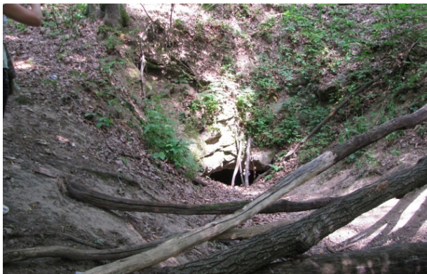
Рис. 2. Зупинка 2 «Печера Тамплієрів» ( http://www.mukachevo.net/ua/news/view/152544 )

Друга зупинка на маршруті, це печера Тамплієрів, про яку складено безліч історій, тутешнє населення називає її Морським Оком. Печера є рукотворною і створена приблизно XII ст. н. е., за однією із версій печера була створена для зберігання вина, оскільки в цій місцевості основним промислом було виноградарство, від цього й походить назва міста Виноградів, який знаходиться неподалік. На даний час печера є об'єктом дослідження серед екологів та ботаніків, на належному рівні дослідження проведені на незначній території, близько 30 м вглиб, оскільки решта затоплена, що унеможливило проводити дослідження. За іншою версією, печеру створили, як укриття від навал монголо-татар, і згідно цієї версії у печери є вихід неподалік річки Тиса, але на жаль підтвердження цієї версії немає, як і не знайдено вихід із печери. У 2017 році волонтери та учасники АТО за підтримки місцевої влади намагалися відкачати воду із печери, але ця спроба була невдалою, оскільки вода швидко прибуває. Тому питання походження печери і її призначення залишається відкритим. На цій локації можна заглибитися у далеке минуле, розповісти про господарювання в цьому районі, пояснити як люди вміло використовували блага природи для облаштування свого побуту.