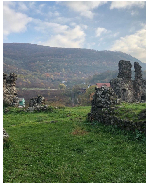
Рис. 7. Зупинка 7 «Канський замок»

Висновки та перспективи подальших розвідок напрямку. На даний час це тільки проект прокладання еколого-пізнавальної стежки на «Чорну Гору» з метою екологічного виховання місцевого населення, учнів та студентів. Для реалізації цього проекту необхідна підтримка державних органів влади та громадськості. Значну увагу варто приділити облаштуванню цього маршруту, зокрема маркуванню, встановленню інформаційних щитів та облаштування місць для збору сміття.