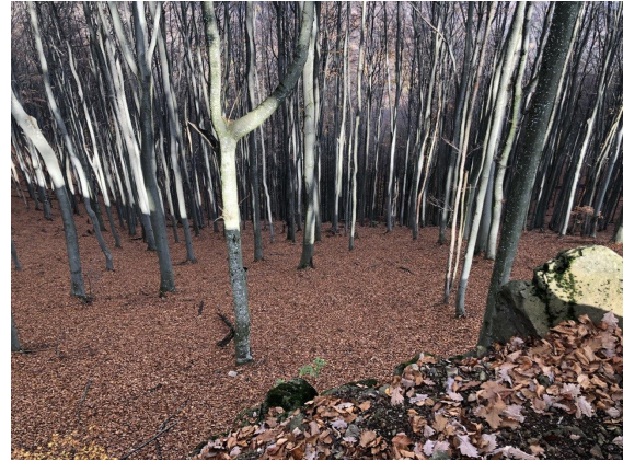
Рис. 3. Зупинка 3 «Буковий гай»

ліс природного походження на північно-східному схилі гори. На цій зупинці спостерігаються деревостани віком понад 100 років. Оглядом майданчиком на цій локації є велика скеля, яка піднімається вище верхнього ярусу дерев. Тут наочно можна показати що таке праліси природного походження, розповісти про особливості росту дерев, пояснити наскільки важливо зберігати ліс з метою попередження виникнення екологічно несприятливих фізико-географічних процесів.