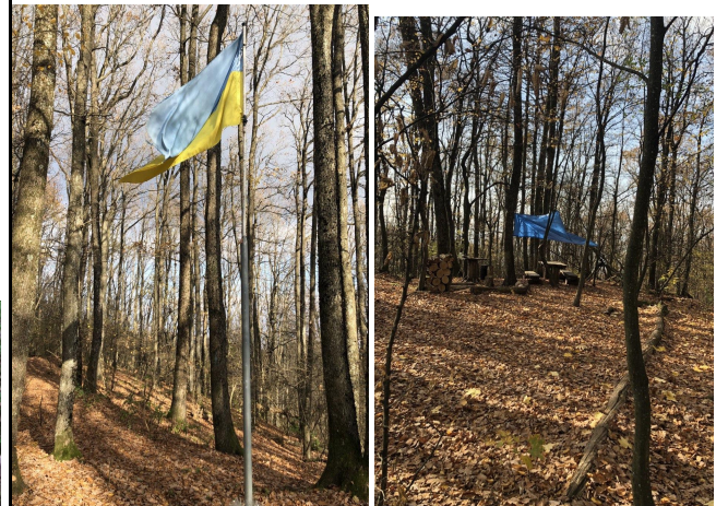
Рис. 4. Зупинка 4 «Чорна Гора»

Четверта зупинка маршруту знаходиться власне на самій Чорній Горі (568 м), тут облаштоване місце для відпочинку рекреантів, зокрема є стіл, мангал та місце укриття від дощу. На цій локації варто основну увагу приділити поняттю охорони природи, пояснити наскільки важливо в гармонії жити з нею, основний акцент зробити на поняттю збалансованого природокористування та сталого розвитку цього регіону.