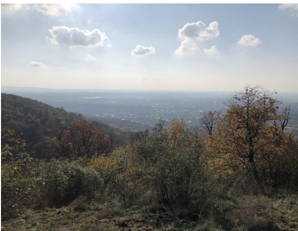
Рис. 6. Зупинка 6 «Оглядний майданчик»

Пройшовши 1-1,5 км, відвідувачі наближаються до наступної зупинки маршруту, а саме до місця огляду зразу декількох чарівних локацій: міста Виноградів з сторічними виноградниками навколо нього, річки Тиси та сусідньої країни – Румунії. На цій локації потрібно акцентувати увагу на таких аспектах: 1) розповісти про історію заселення цієї території, пояснити як рельєф вплинув на конфігурацію міста; 2) розповісти про кліматичні особливості Закарпатської області та їх вплив на спосіб господарювання, зокрема на ведення виноградарства впродовж тривалого часу; 3) можна наочно побачити як діяльність річки впродовж століть поглиблювала своє русло і формувала тераси, які тепер щільно забудовані. Тут слід пояснити поняття цілісності природи та взаємозалежності між компонентами.