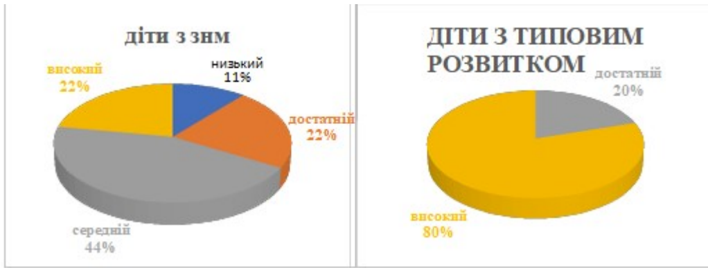
Рис. 1. Рівні сформованості родинно-побутової компетентності у дітей молодшого дошкільного віку

В ході проведення якісної і кількісної обробки результатів дослідження родинно-побутової компетентності дітей молодшого дошкільного віку із ЗНМ часто спостерігались незнання імен мам чи тата, плутання в іменах або надання дитиною на запитання «Як звати тата і маму?» відповіді: що вона не знає або просто «мама» чи «тато». Зазвичай ці діти проявляли цікавість до занять членів сім'ї, а також прагнули допомагати, однак швидко втрачали інтерес до тої чи іншої діяльності, замінюючи її на предметну діяльність з іграшками.