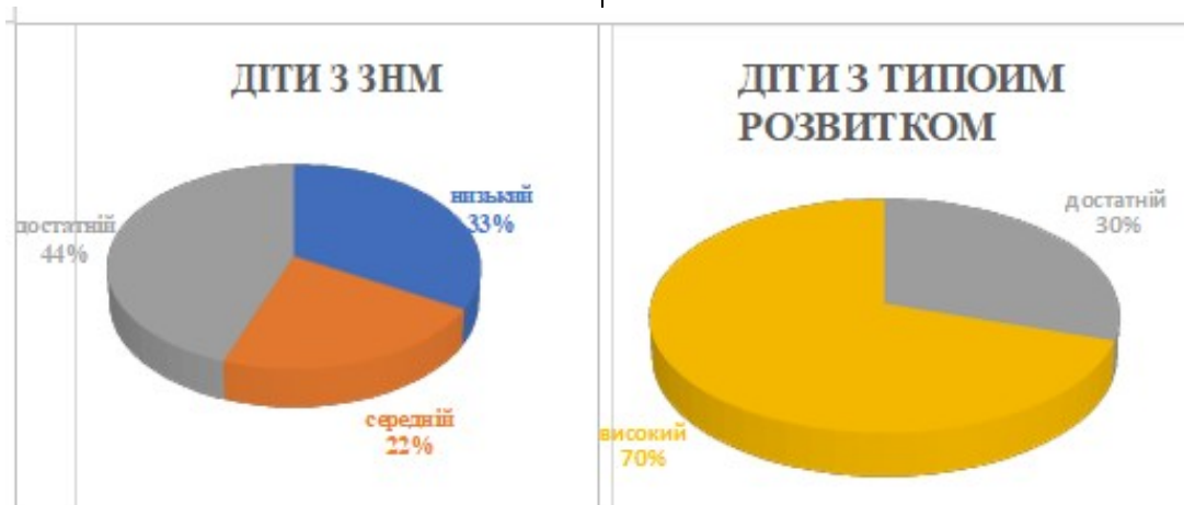
Рис. 2. Рівні сформованості соціально-комунікативної компетентності дітей молодшого дошкільного віку

компетентність дітей молодшого дошкільного віку із ЗНМ сформована практично на однаковому рівні з родинно-побутовою компетентністю, а саме: переважна більшість дітей мають достатній рівень сформованості – 45%, у 70% дітей молодшого дошкільного віку з типовим розвитком наявний високий рівень сформованості компетентності щодо дотримання доступних за віком норм спілкування з однолітками (рис. 2).