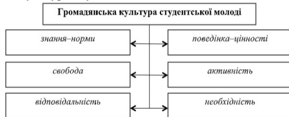
Рис. 1.2. Структура громадянської культури студентської молоді

В означеній схемі особливий акцент зроблено на формуванні структурних компонентів громадянськості, а саме: громадянській самосвідомості, позиції й поведінці. Визначеній системі громадянського виховання відповідає структура громадянської культури студентської молоді.