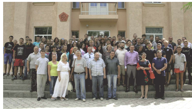
Рис. 1. Учасники археологічної школи на Більському городищі у 2015 р.

установ із багатьох міст, які представляли чотири країни світу: Україну, Польщу, Молдову та Японію. Вагомим було представництво закладів вищої освіти. Зокрема, в заходах школи брали участь студенти та аспіранти цілої низки університетів: Центральноукраїнського державного педагогічного університету імені Володимира Винниченка, Криворізького державного педагогічного університету, Київського національного університету культури і мистецтв, Київського національного університету імені Тараса Шевченка, Черкаського національного університету, Харківського національного університету імені В. Н. Каразіна, Дніпровського національного університету імені Олеся Гончара, Кам'янець-Подільського національного університету імені Івана Огієнка, Сумського державного педагогічного університету імені А. С. Макаренка, а також – Університету Ягеллонського (Краків, Польща). Важливим стало доручення до роботи школи музейних установ, що надають можливість практики із фондovими матеріалами та об'єктами. Окрім заповідників-співорганізаторів, тут варто згадати Токійський національний музей (Японія) 4 , Кам'янський державний заповідник та Археологічний музей імені Нінель Бокій Центральноукраїнського державного педагогічного університету. Важливим стало залучення колег з наукових установ сусідніх держав, зокрема Інституту культурної спадщини Академії наук Республіки Молдова 5 .