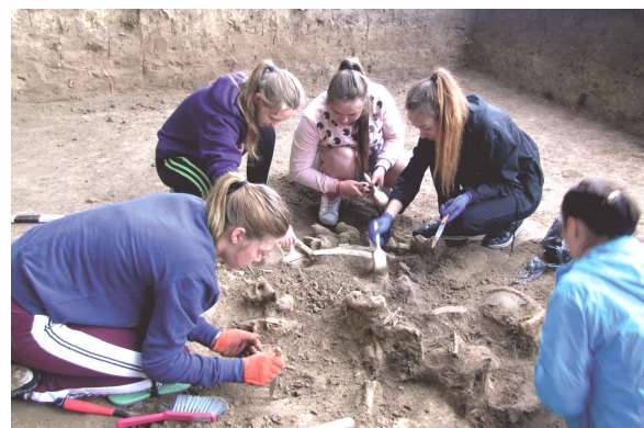
Рис. 7. Розчистка археологічного об'єкту на Мотронинському городищі, 2017 р.