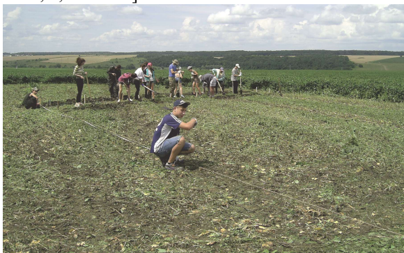
Рис. 2. Розкопки селища Перше Поле

Масштабністю вирізняється оборонна система Мотронинського городища, знакової пам'ятки, до якої вже давно прикута увага дослідників [27, с. 98–99; 2; 22, с. 68–77]. Експедиційні роботи були зосереджені тут на вивченні житлових та господарчих об'єктів, оборонної системи. Водночас здійснено розвідки поселенської структури в околицях городища. Нові поселення епох фінальної бронзи – раннього заліза відкрито біля сіл Мельники, Флярківка, Грушківка [16, с. 306–307; 1, с. 256–257]. Значними були роботами на поховальних комплексах зазначених пам'яток. Важливо, що досліджені всі їх типи, властиві для Східноєвропейського Лісостепу в той час: кургани, ґрунтові поховання, захоронення у житлово-господарчих об'єктах, та знахідки окремих кісток. Останні, за деякими припущеннями, можуть бути решками заупокійних обрядів виставлення [3, с. 119–122]. Так, на Більських некрополях досліджувався один із курганів Перещепинського могильника [17, с. 139–140; 18, с. 59–66]. На селищі «Перше Поле» виявлено окремі людські кістки [17, с. 140; 18, с. 68; 5, с. 97–99].