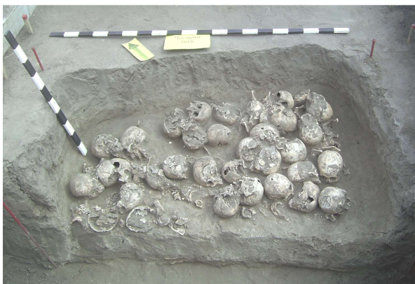
Рис. 4. Колективне захоронення у Чигирині, 2018 р.