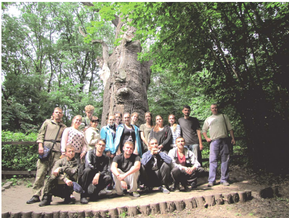
Рис. 9. Під час екскурсії до пам'ятки природи «Дуб Максима Залізняка» у Холодному Ярі

Висновки та перспективи подальших розвідок напрямку. Таким чином, учасники археологічної школи могли отримати широкий спектр знань – від польових розвідок і розкопок, виявлення об'єктів та артефактів, до їх обліку, консервації та музеєфікації. А також – до їх наукової обробки, публікації, введення до системи наукових знань. І, зрештою, до написання фундаментальних узагальнюючих праць з залученням матеріалів цих відкриттів.