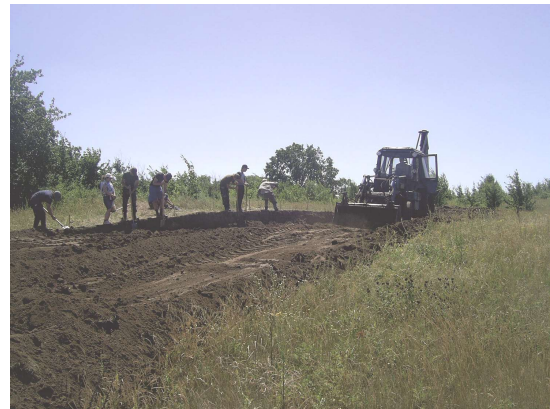
Рис. 3 Дослідження кургану поблизу с. Михайлівка у 2017 р.

На могильнику Мотронинського городища досліджено низку курганів ззовні валів цитаделі [15, с. 307]. Важливими, окрім цього, стали роботи на дальній групі курганів на південний захід від укріплення. Тут виявлено поховально-поминальні комплекси передскіфського часу, у окремі з яких впуснені поховання скіфської доби [14, с. 75–88]. Нові цікаві матеріали дали розкопки курганної групи біля с. Михайлівка. Поховання здійснені у ямі чи стовповій гробниці, причому остання містила кінське поховання. Зі знахідок виділяються чудові вуздечні набори середньоскіфського періоду [11, с. 92–110]. Окрім цього, безпосередньо на території Мотронинського городища виявлено ґрунтове поховання, впуснене в підніжжя валу. А також – захоронення черепа в одній з господарчих ям.